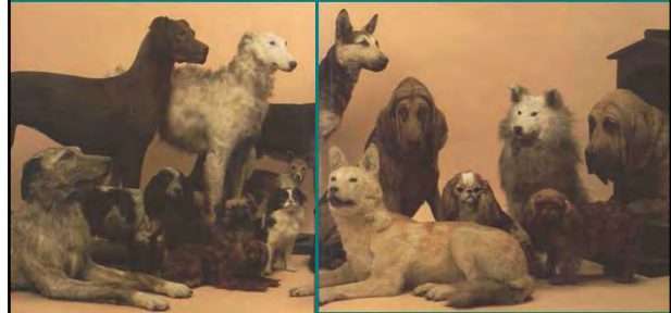
alle honden stammen af van de wolf, Canis lupus

groottevariatie bij honden: Deense dog 107 cm hoog; Chihuahua: 19 cm